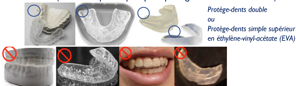
Protège-dents double ou Protège-dents simple supérieur en éthylène-vinyl-acétate (EVA)

Remarque : L'athlète ne peut pas porter un protège-dents orthodontique (gouttière dentaire) pour remodeler la position des dents (ils ne sont pas adaptés pour protéger les dents en combat).