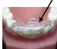
Protège-dents inférieur couvrant toutes les dents

Le protège-dents inférieur partiel est accepté pour les personnes portant un appareil dentaire UNIQUEMENT sur les dents du haut .