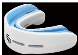
Protège-dents double blanc ou transparent ET incolore